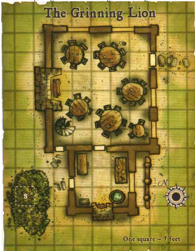
Hala Myrt: (Femme humaine, Tethyr, Gens du peuple 1)

Orlpar qui entretient des relations de longue date avec la guilde de Xanathar reçoit régulièrement des chargements d'Unger Farshal.